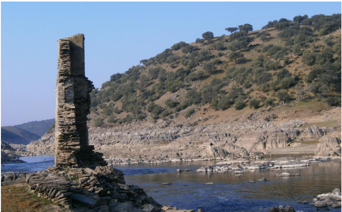
Aceña del Tío Jeromo

La Aceña conserva en parte el conjunto de aprovechamiento hídrico. Antiguamente se utilizaba como molino de harina, aunque hoy en día está prácticamente derrumbado, principalmente por las crecidas del río. Cuando las aguas del embalse decrecen podemos observar las ruedas molederas.