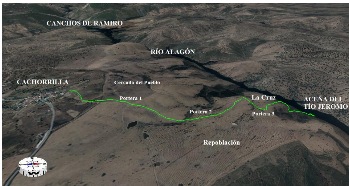
Mapa Ruta Aceña del Tío Jeromo