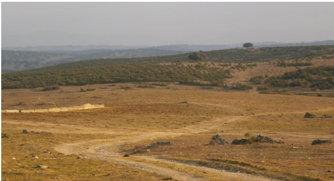
Camino vecinal antes de cruzar el arroyo del infierno

Una vez dentro de la finca, entre la primera y la segunda portera nos encontramos con numerosas cabezas de ganado vacuno suelto.