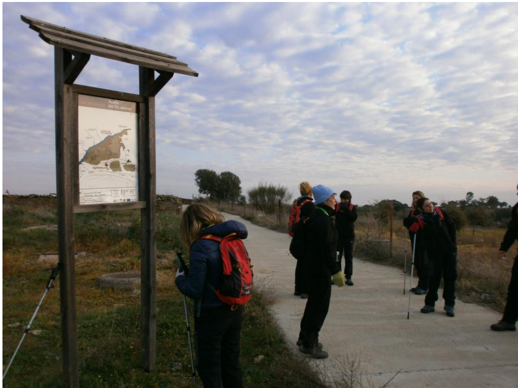
Inicio de la ruta

Continúa por una calleja a las afueras de la localidad, dejando a la izquierda, el Mercado del Pueblo, hasta desembocar en un camino vecinal que nos lleva a la zona del Arroyo del Infierno. Aquí nos encontramos con la primera portera.