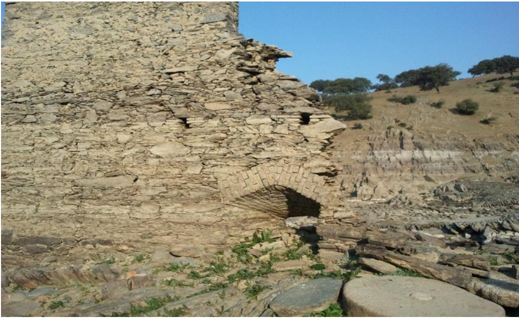
Pizarra y Molederas

GEOLOGÍA: Al finalizar la ruta encontramos pizarra a la orilla del río.