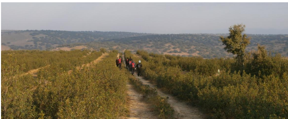
Camino por la repoblación forestal

Una vez llegamos a la segunda portera pasamos a una zona con una repoblación de alcornoques. Seguimos por la zona de la Cruz hasta alcanzar la tercera y última portera.