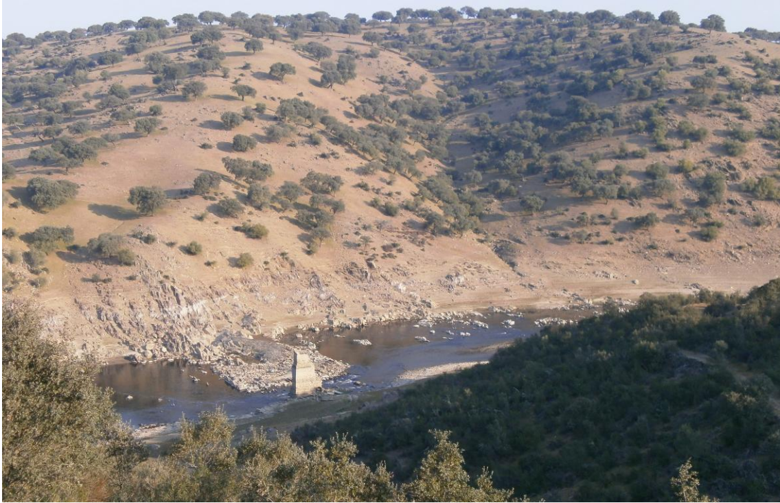
Vistas de Río Alagón y Aceña del Tío Jeromo

La Aceña conserva en parte el conjunto de aprovechamiento hídrico. Antiguamente se utilizaba como molino de harina, aunque hoy en día está prácticamente derrumbado, principalmente por las crecidas del río. Cuando las aguas del embalse decrecen podemos observar las ruedas molederas.